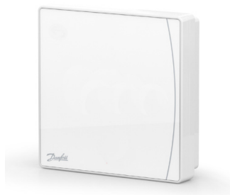
Danfoss Icon2™ Sensor 088U2120